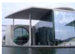
La Cité gouvernementale de Berlin